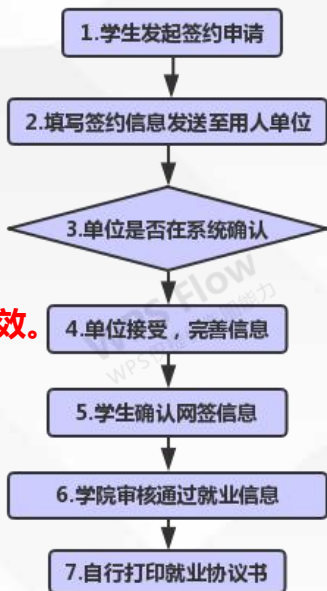
学生端发起签约流程图